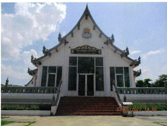
หอพระพุทธร