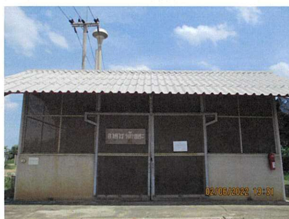
ภาพถ่ายที่ 1.6.3-2 อาคารพัสดุ