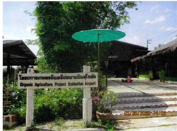
โครงการเกษตรอินทรีย์