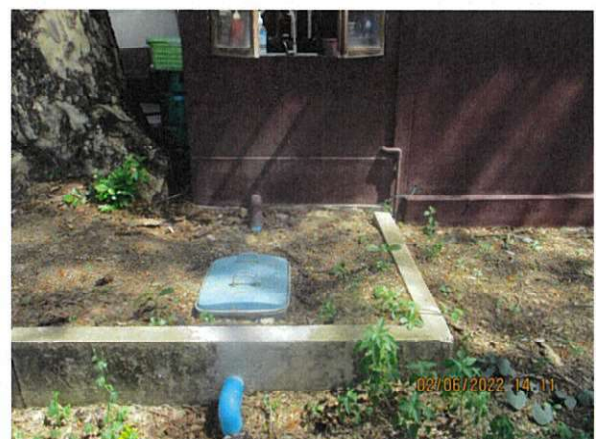
ภาพถ่ายที่ 1.6.1-3 ถังดักไขมันบริเวณร้านอาหารภายในสนามบินสุโขทัย