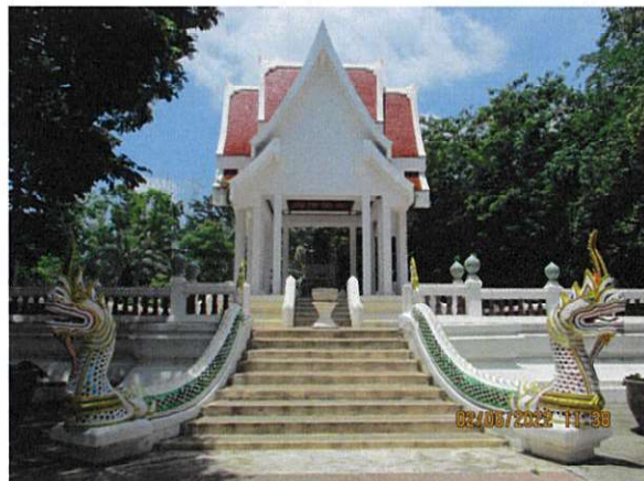
หลวงพ่อศิลา(จำลอง)