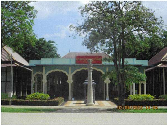
หลวงพ่отันใจ