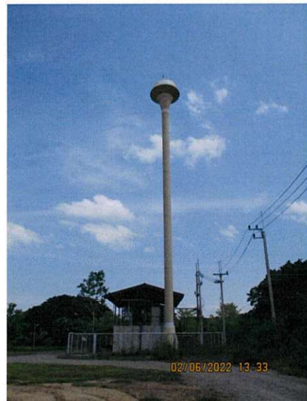
ภาพถ่ายที่ 1.6.1-1 ระบบผลิตน้ำใช้