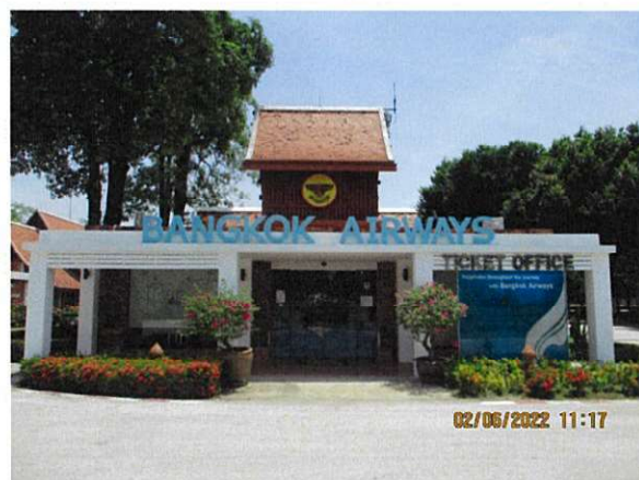
อาคารจำหน่ายบัตรโดยสาร