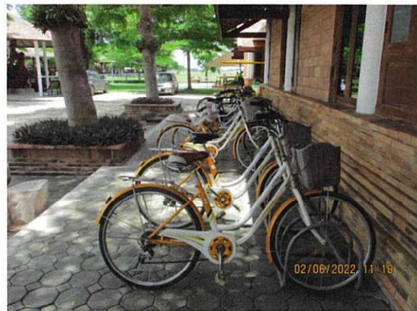
ลานจอดรถจักรยาน