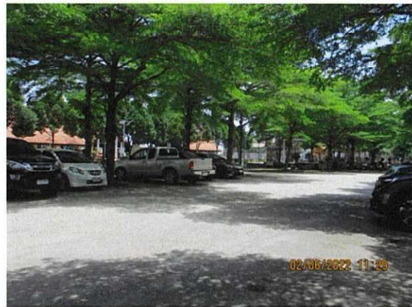
ลานจอดรถยนต์