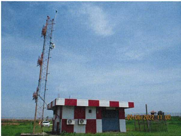
อาคารวิทยุช่วยการเดินอากาศ