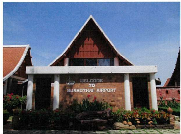
อาคารที่พักผู้โดยสาร

ภาพถ่ายที่ 1.4.2-1 องค์ประกอบต่างๆ ภายในสนามบินสุโขทัย