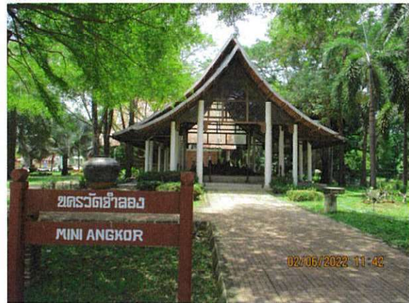
นครวัดจำลอง