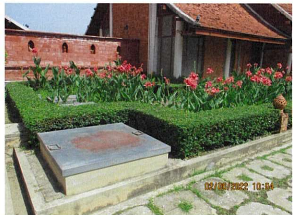
ภาพถ่ายที่ 1.6.1-2 แสดงระบบบำบัดน้ำเสียสำเร็จรูปของโครงการ บริเวณอาคารผู้โดยสารขาเข้า-ขาออก