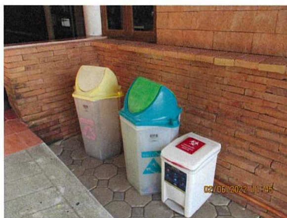
ภาพถ่ายที่ 1.6.3-1 ถังขยะบริเวณสนามบิน