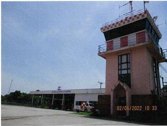
อาคารหอบังคับการบิน