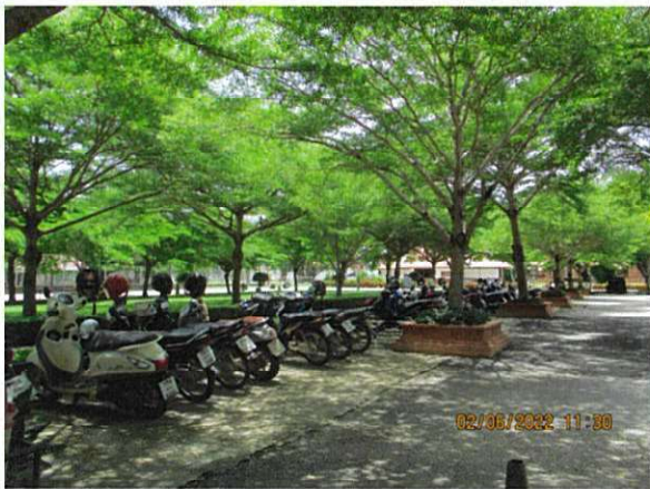
ลานจอดรถจักรยานยนต์