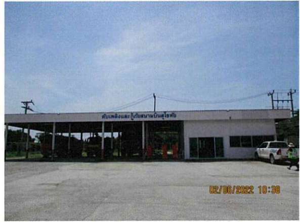
สถานีดับเพลิง